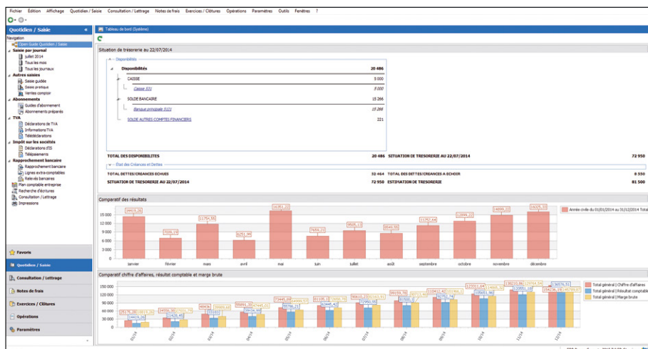
Grâce au tableau de bord, visualisez rapidement les indicateurs clés de votre entreprise : chiffre d'affaires, résultats, etc.

Suivez votre situation de trésorerie en temps réel. Grâce à des tableaux de bord pré-paramétrés, les chiffres clés de votre entreprise sont à portée de main, partout et tout le temps. D'un coup d'œil, visualisez les indicateurs de performance : chiffre d'affaires, résultat comptable, marge brute, trésorerie, etc. Grâce aux liens hypertextes, d'un simple clic vous ouvrez une fenêtre pour avoir plus de détails sur une information. Ainsi, vous accédez rapidement à toutes vos données importantes et réagissez aussitôt.